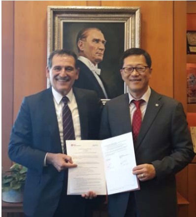
MOU 서명 후 기념 촬영